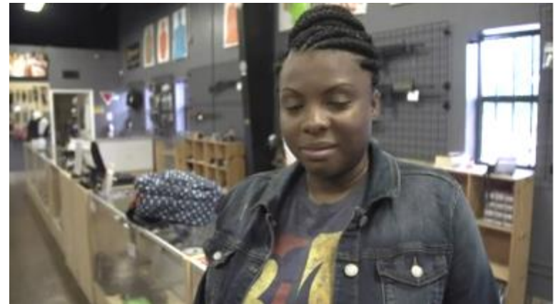
This clip shows the problem...

Michael Moore Explains Why TRUMP Will Win